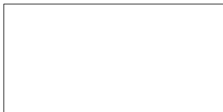
図 1 図の説明 (10.5pt)